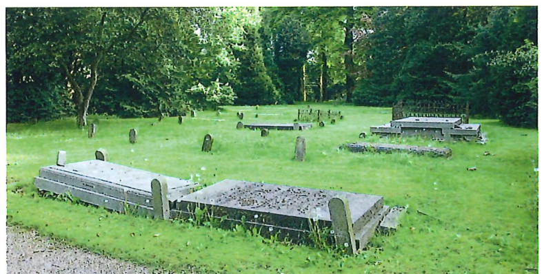
Begraafplaats Soestbergen.