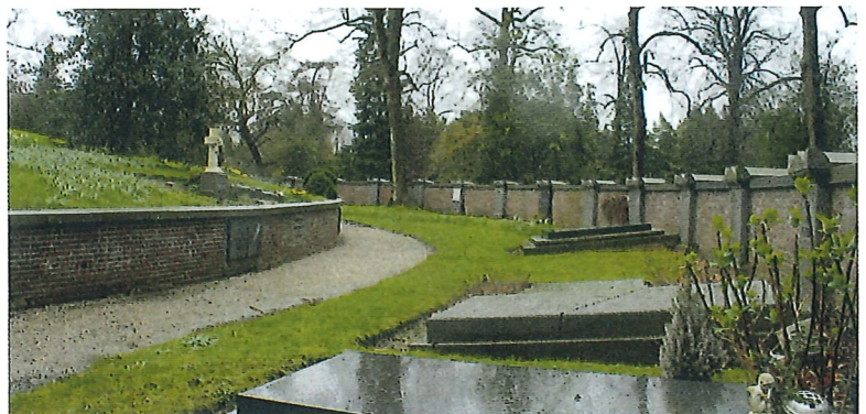
De zogenaamde ‘Ring van Zoicher’, een bijzondere cirkel van grafkelders.