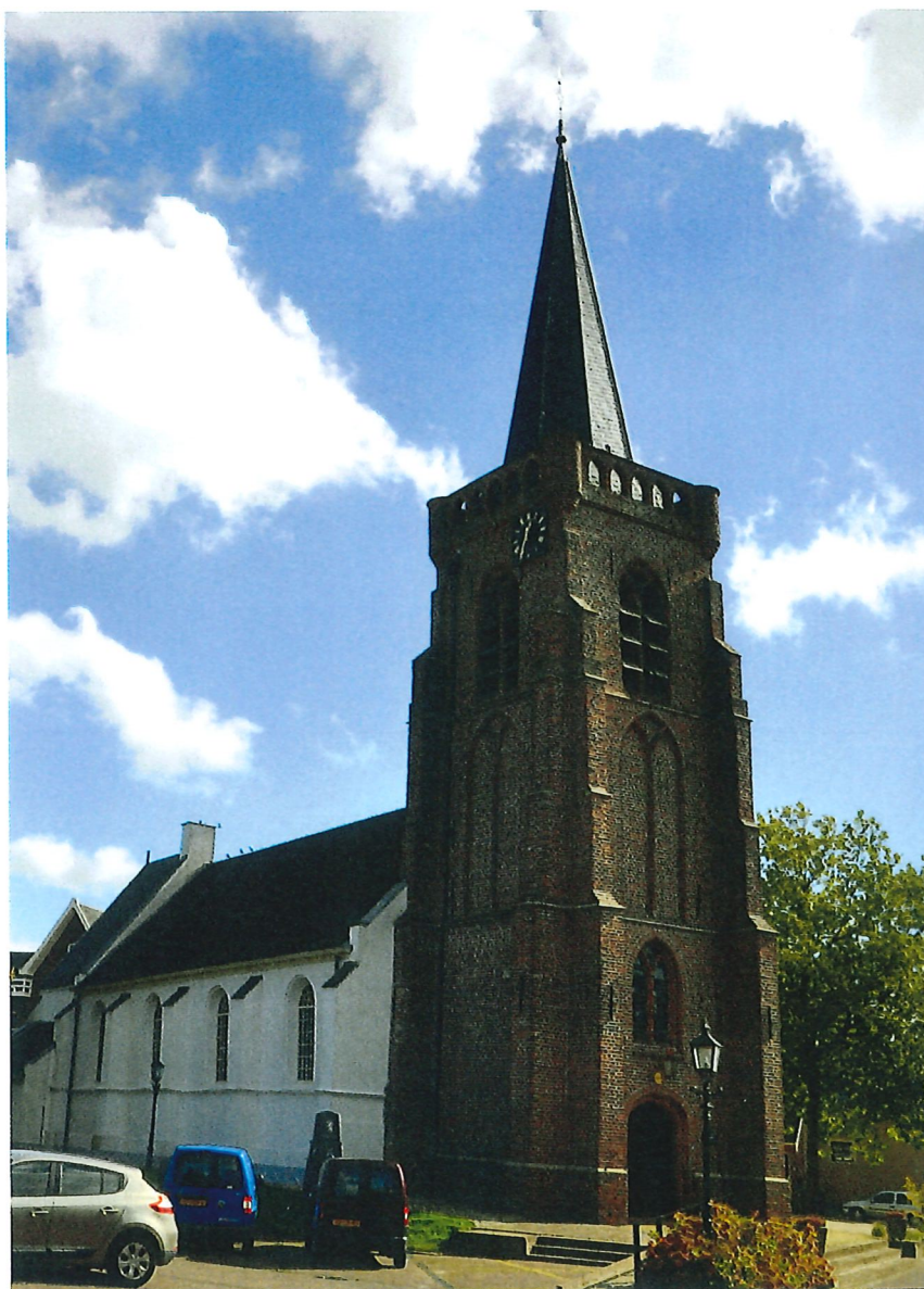
De Nederlands Hervormde kerk te Jaarsveld.

Een van deze abonnees is de Nederlands Hervormde kerk te Jaarsveld. Deze kerk stamt uit de veertiende eeuw en bestaat uit een toren, kerkzaal en koor met consistorie. Het kerkgebouw wordt langjarig door de wachters van Monumentenwacht Utrecht bezocht. Voor het kerkbestuur is het een zorg minder dat het gebouw na de inspectie weer wind- en waterdicht is. Daarnaast staat de Monumentenwacht de kerkvoogdij bij tijdens de benodigde onderhoudswerkzaamheden. De kerk staat er goed bij maar kent wel enkele kwetsbare punten. Het pleisterwerk met schilderwerk van de gevels vraagt bijvoorbeeld regelmatig onderhoud en de leibedekking van het koor en de gootbekleding worden sleets. Het kerkbestuur wil graag dat deze worden vervangen zodat het kerkgebouw weer jaren vooruit kan. Recent is begonnen met voorbereidende werkzaamheden. Monumentenwacht Utrecht staat het bestuur hierin bij door middel van extra inspecties op het uit te voeren werk en het geven van advies over werkzaamheden aan detailleringen en de wijze van aanbrengen.